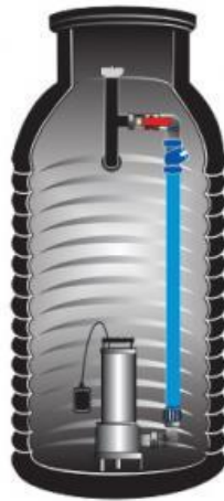
Rys.2. Przekrój przepompowni ESEPTIK