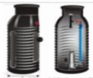
ESEPTIK (Z POMPAMI O WIRNIKACH ROZDRABNIAJĄCYCH ORAZ SPRZĘGIEM)