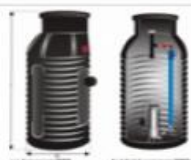
ESEPTIK (Z POMPAMI O WIRNIKACH OTWARTYCH ORAZ SPRZĘGIEM)