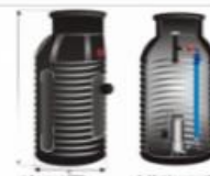
ESEPTIK (Z POMPAMI O WIRNIKACH KANAŁOWYCH ORAZ SPRZĘGIEM)